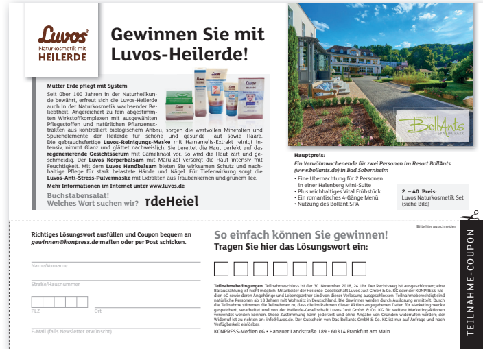
Beispiel, Originalabbildung in DIN A5