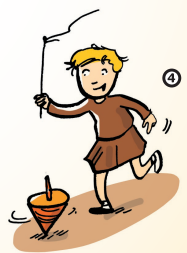
Illustration: Liliane Oser